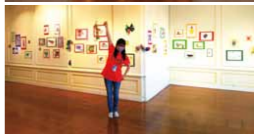
▲ 2021.7.10～9.6 ハウステンボス美術館『世界一美しい昆虫展 2021』