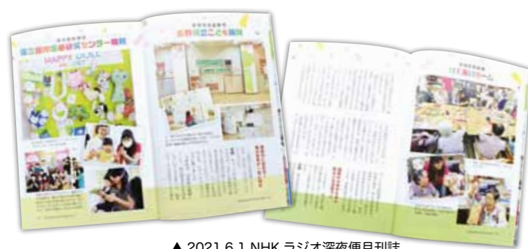
▲ 2021.6.1 NHK ラジオ深夜便月刊誌