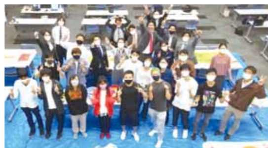
▲ 2021.10.12 厚木青年会議所